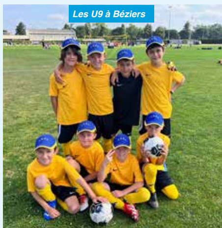
Les U9 à Béziers

Il n'y a pas que les anciens qui font des voyages récréatifs, nos jeunes pousses (U9) – eux - se sont déplacés à BEZIERS pour participer à un grand tournoi de football. Sur six rencontres, nos représentants en emportèrent quatre. Une très bonne performance. Educateurs, joueurs et accompagnateurs ont passé un super week-end.