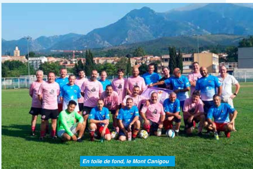
En toile de fond, le Mont Canigou

Puis, foot oblige, ils prirent la direction de Prades pour affronter à 18 heures leurs homologues locaux. Match très sympathique qui se termina – bien sûr – par une victoire auzielloise. Pour récupérer de leur fatigue, les deux équipes organisèrent une « petite soirée » : grillades, feu de camp, chansons, etc..- soirée qui se termina tard au petit matin. Dimanche matin malgré le peu de sommeil, les jambes lourdes, quelques clochettes dans le crâne, nos vétérans rejoignirent Auzielle.